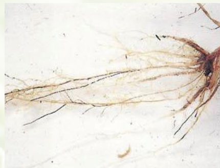
Schritt 6 Zuordnung einer Befallsklasse