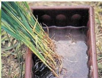
Schritt 4 Wurzelballen einweichen