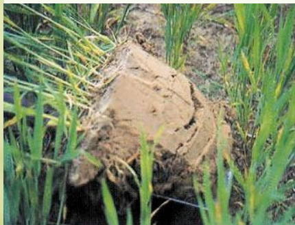
Schritt 1 Mit Spaten ausgraben