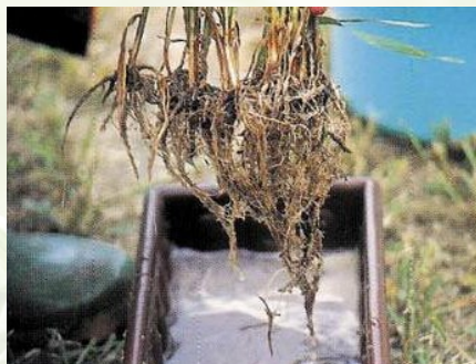
Schritt 5 Mehrmals sorgfältig waschen