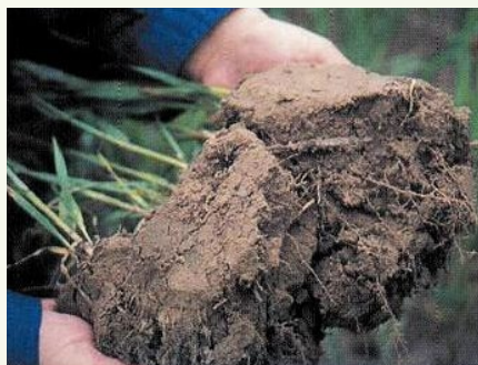
Schritt 2 Wurzelballen etwas trennen