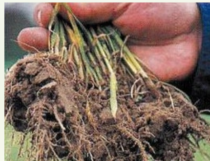
Schritt 3 Vorsichtig Erde abschütteln